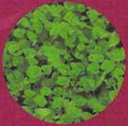
GOTU KOLA ou BRAHMI