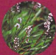
JATAMANSI ou NARD